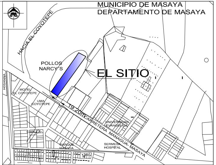
MUNICIPIO DE MASAYA DEPARTAMENTO DE MASAYA MAPA DE UBICACIÓN ESCALA.....GRÁFICA